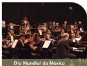
Dia Mundial da Música