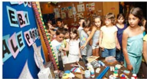
Casas com Histórias