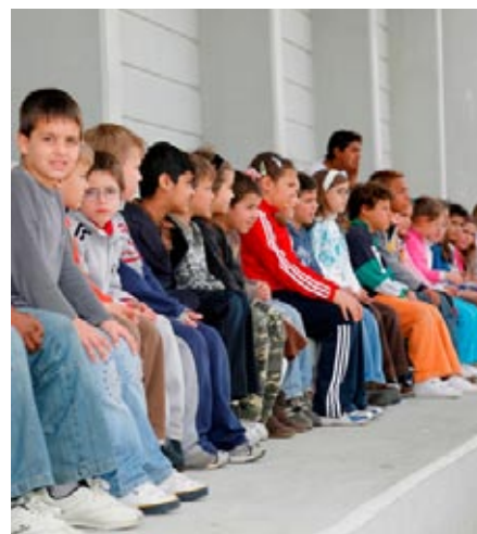
QUADRO I LIVROS E MATERIAL ESCOLAR Ensino Básico