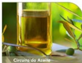
Circuito do Azeite

Auditório Municipal de Albufeira | 17h00