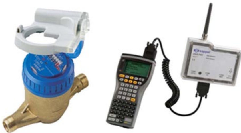
Contador, módulo emissor e recetor de rádio

Com a ampliação do STD, a Câmara Municipal ambiciona, ainda, contribuir para a redução e controlo das perdas de água no sistema de distribuição. Entre 2005, ano de implementação da teleleitura no concelho, e 2010, assistiu-se a uma redução de 5 por cento nos indicadores de percentagem de água não faturada pelo Município.