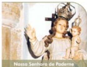
Nossa Senhora de Paderne

Espaço Multiusos de Albufeira | 15h00 às 23h00