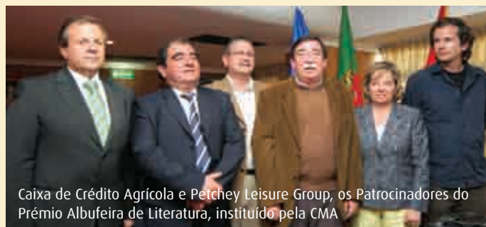
Caixa de Crédito Agrícola e Petchey Leisure Group, os Patrocinadores do Prémio Albufeira de Literatura, instituído pela CMA