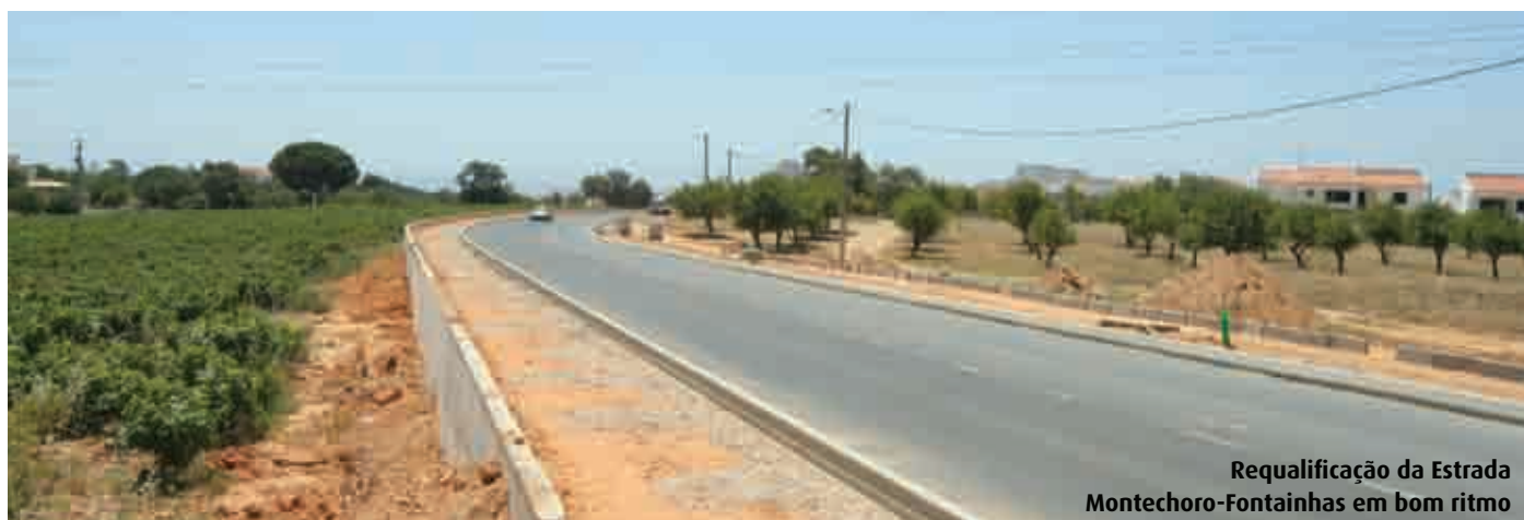
Requalificação da Estrada Montechoro-Fontainhas em bom ritmo

Sim, temos a decorrer a requalificação da Avenida dos Descobrimentos, entre o cruzamento do Lidl e o cruzamento da CMA, sendo uma requalificação que contempla igualmente a construção de novas infra-estruturas de água, esgotos e pluviais, iluminação pública, passeios, pista ciclável. Traduz-se num investimento de cerca de 700 mil Euros, com prazo de execução de 6 meses.