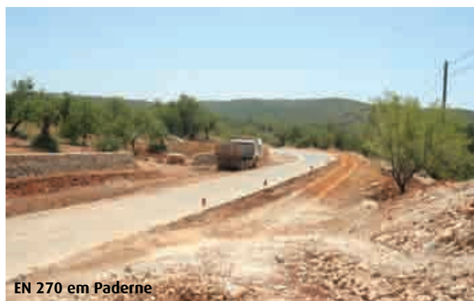
EN 270 em Paderne

Sim, na Guia está terminada a 1ª fase do arranjo urbanístico que dotou as artérias intervenionadas, nomeadamente as ruas 1º de Maio, do Mercado, da Liberdade, General Humberto Delgado, das Escolas, Joaquim Martins Rodrigues e São Sebastião, de novas infra-estruturas de água, esgotos, pluviais e iluminação pública, repavimentação da faixa de rodagem, passeios e sinalização, sendo que foi ainda construída uma rotunda na entrada da povoação. Trata-se da primeira fase da obra, estando previsto o arranque da segunda fase até ao final deste ano.