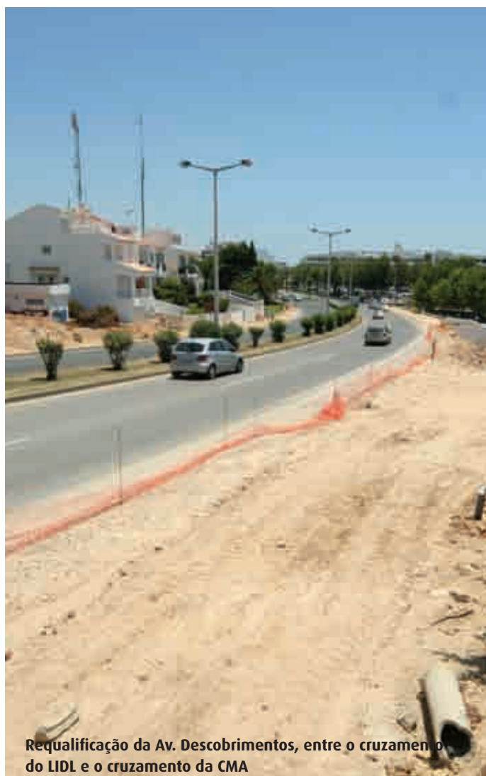
Requalificação da Av. Descobrimentos, entre o cruzamento do LIDL e o cruzamento da CMA

Sim, temos a decorrer a requalificação da Avenida dos Descobrimentos, entre o cruzamento do Lidl e o cruzamento da CMA, sendo uma requalificação que contempla igualmente a construção de novas infra-estruturas de água, esgotos e pluviais, iluminação pública, passeios, pista ciclável. Traduz-se num investimento de cerca de 700 mil Euros, com prazo de execução de 6 meses.