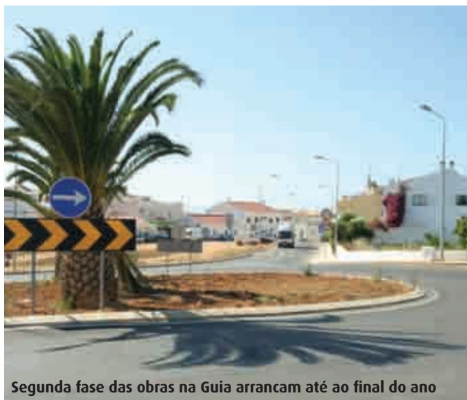
Segunda fase das obras na Guia arrancam até ao final do ano

Sim, na Guia está terminada a 1ª fase do arranjo urbanístico que dotou as artérias intervenionadas, nomeadamente as ruas 1º de Maio, do Mercado, da Liberdade, General Humberto Delgado, das Escolas, Joaquim Martins Rodrigues e São Sebastião, de novas infra-estruturas de água, esgotos, pluviais e iluminação pública, repavimentação da faixa de rodagem, passeios e sinalização, sendo que foi ainda construída uma rotunda na entrada da povoação. Trata-se da primeira fase da obra, estando previsto o arranque da segunda fase até ao final deste ano.