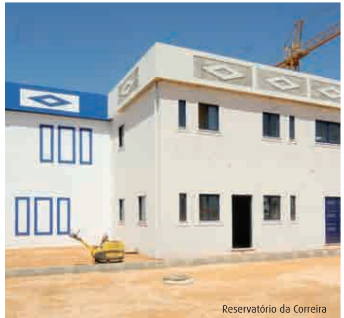
Reservatório da Correia

Refira-se que em Maio foi também concluído o novo troço da conduta de abastecimento de água, que faz a interligação da zona Sul Central com a zona Sul Poente da cidade. Este novo troço de conduta de abastecimento de água interliga em termos definitivos os subsistemas de abastecimento de água Sul-Central, Sul-Poente, o que permitirá efectuar uma gestão destes subsistemas de abastecimento de água com uma maior flexibilidade e, consequentemente, diminuir as probabilidades de eventuais faltas de água nos mesmos, em caso de ocorrência de rotura. O subsistema Sul-Central compreende as áreas de influência dos reservatórios da Mosqueira, Correeira e Montechoro (zonas de Vale Paraíso, Brejos, Montechoro, Correeira, Areias de S. João, Vale Faro e Oura). O subsistema Sul-Poente é delimitado pelos limites Poente e Sul do Concelho e compreende as áreas de influência dos reservatórios de Bem Parece, Malpique, Cerro da Águia, Patroves, Castelo e Sesmarias (zonas de Guia, Montes Juntos, Vale de Parra, Galé, Sesmarias, Patroves, Pátio e Albufeira). Esta obra teve um prazo de execução de 2 meses e um custo de 123.200 Euros.