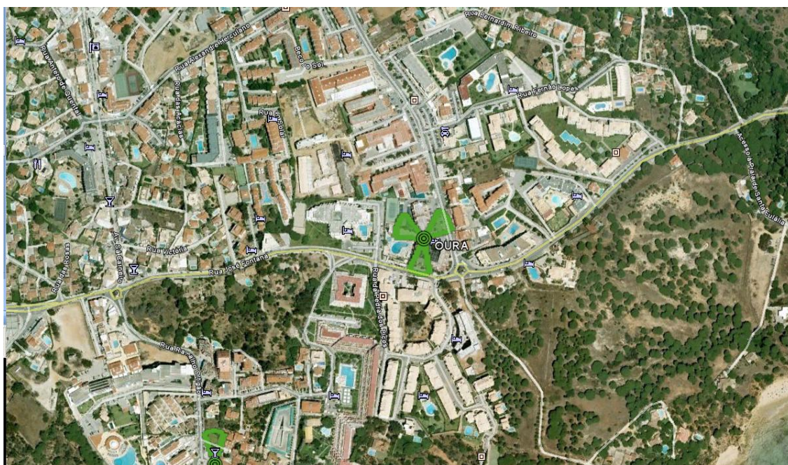
Fig. 2 – Foto da localização da estação OURA (98AG036).

Cada medição teve uma duração de 6 minutos. Ensaios realizados a uma temperatura cerca de 33°C.