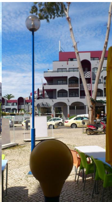
Fig. 7 – Ponto 5