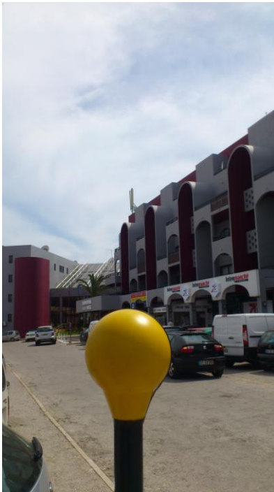
Fig. 3 – Ponto 1