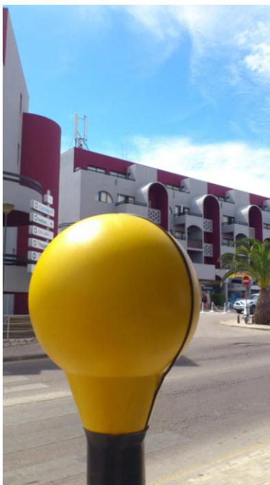
Fig. 6 – Ponto 4