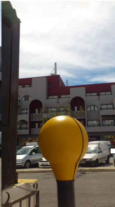
Fig. 4 – Ponto 2